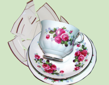
Plate glass زجاج الصحون Πιατικά Cristallo 사기 접시류 Фарфоровая и стеклянная посуда 厚玻璃板 பிளேட், கிளாஸ் Phiến thủy tinh

Packing foam فوم التغليف Αφρώδες υλικό συσκευασίας Polistirolo 포장용 스티로폼 Пенопласт பேக்கிங் ஃபோம் Bọt biển gói hàng