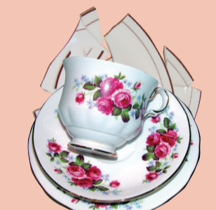
Plate glass زجاج الصحون Πιατικά Cristallo 사기 접시류 Фарфоровая и стеклянная посуда 厚玻璃板 பிளேட், கிளாஸ் Phiến thủy tinh

Neon tubes or light globes أنابيب النيون أو مصابيح الإضاءة Λαμπτήρες νέον και λάμπες Tubi in neon o lampadine 네온 튜브나 전구 Неоновые трубки и лампочки накаливания 氖管或灯泡 Bóng đèn neon hoặc bóng đèn tròn